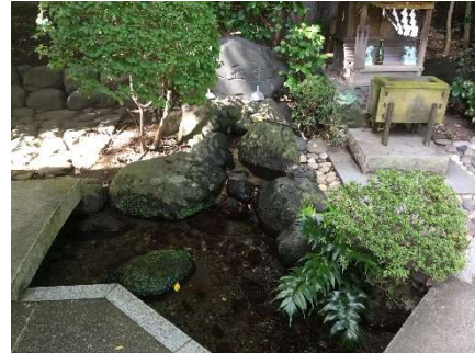
大社内の湧き水 (お水取り)