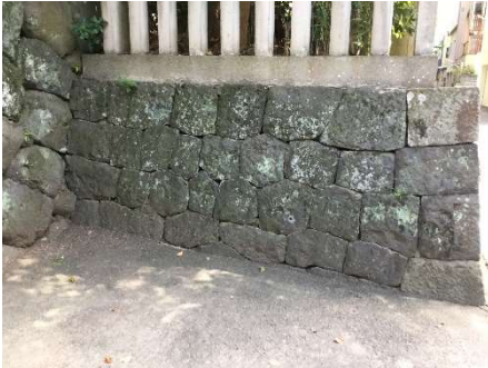
石垣に使われています。